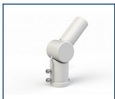
Кронштейн поворотный 90 град. Caiman / Unit